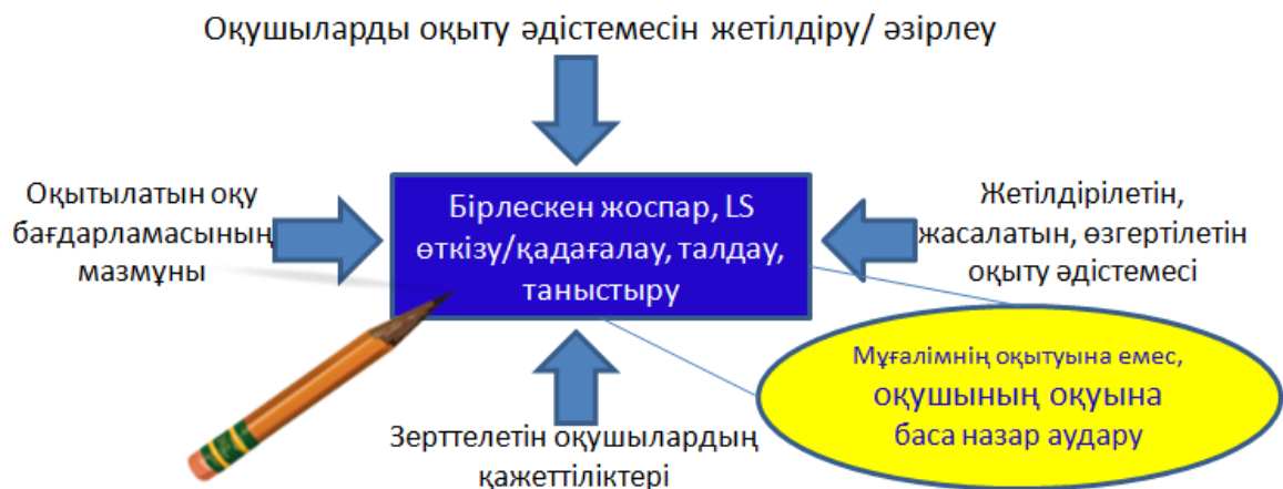
2-сурет. Lesson Study қағидастары